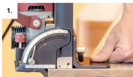
1. P-System Nut mit der Einstellung P-14 fräsen