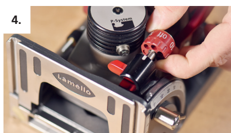
4. Zum Justieren P-System-Tiefensteller ziehen und auf «Off» drehen