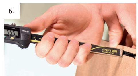
6. Erneute Testfräsung machen und nachmessen