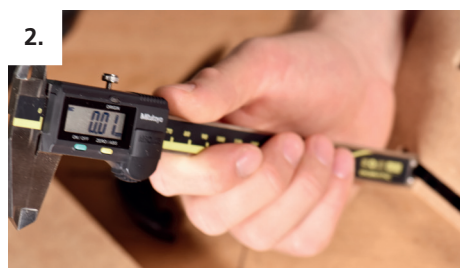
2. P-14 Verbinderrhälfte einschieben und Rücksprung messen